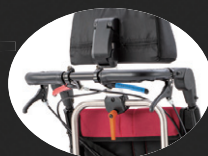
角度が変えられる「手押しハンドル」