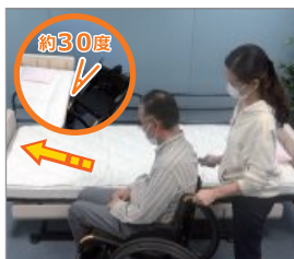
車いすを30度ぐらいを目安にベッド脇に付ける