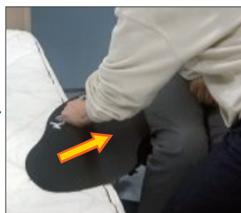
スライディをお尻の下に差し込む