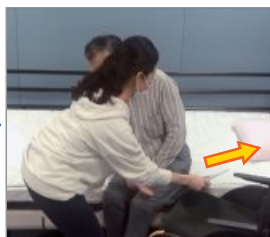
スライディを引き抜き移乗完了